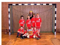
Das Team 2010/2011 E2 Jugend Jahrgang 00 / 01